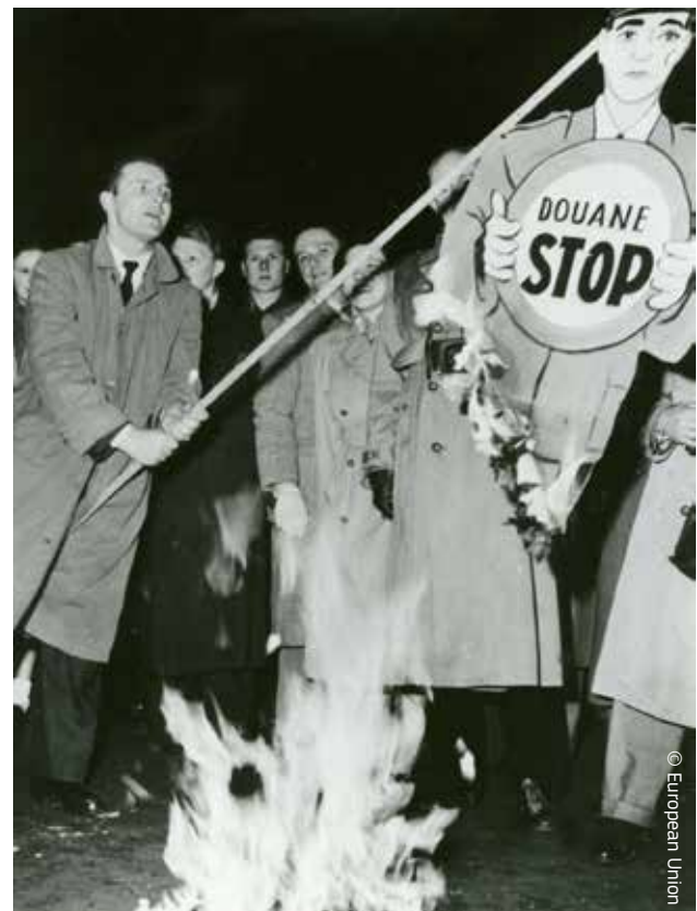
Demonstracja członków belgijskiej sekcji Ruchu Europejskiego przeciwko kontrolom granicznym w Liège w 1953 r.

Przy każdym kolejnym rozszerzeniu Unii Europejskiej nowe państwa przystępowały również do unii celnej, co powodowało konieczność dostosowania ich przepisów krajowych do unijnego kodeksu celnego. Monako, państwo spoza UE, było już w unii celnej z Francją, podczas gdy Andora i San Marino zawarły porozumienia w 1991 r. Unia celna UE–Turcja weszła w życie w 1995 r., ale tak samo jak w przypadku Andory jest ona ograniczona do produktów przemysłowych i przetworzonych produktów rolnych.